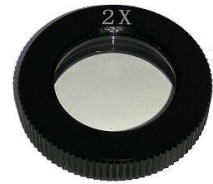
各式輔助鏡: 0.5x、0.75x、 1x、1.5x、2x