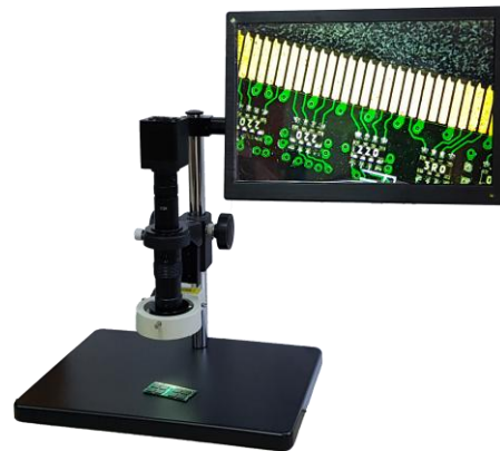
可搭配 CCD 及螢幕