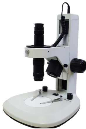
可搭配上光源底座