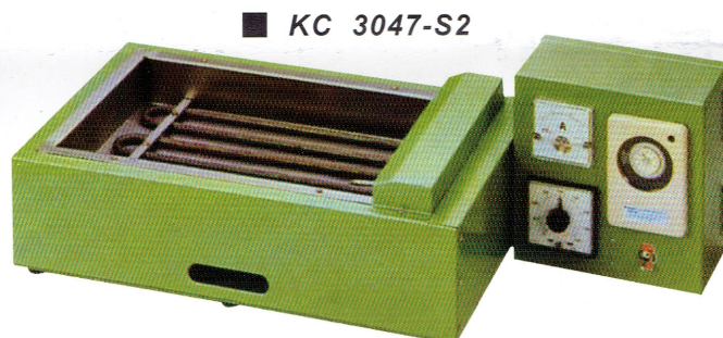
■ KC 3047-S2